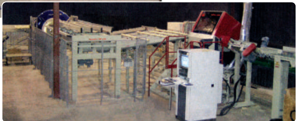
Centre de débitage – entrée automatisée, équipement de manutention, scie à optimiser et stations de rejets automatisées.